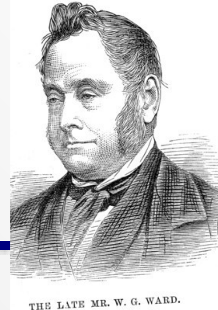
William George Ward (1812-1882)