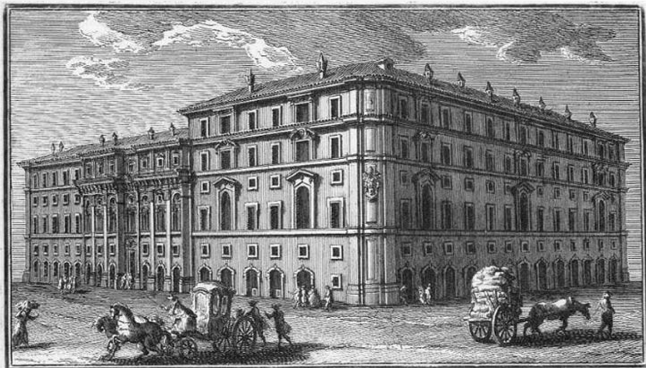
616 9114. Prospetto verso Mezzogiorno del Collegio di Propaganda Fide, e fianco verso ponente, architettura del Borromini