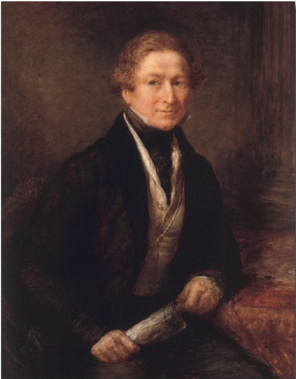
Sir Robert Peel (1788-1850)